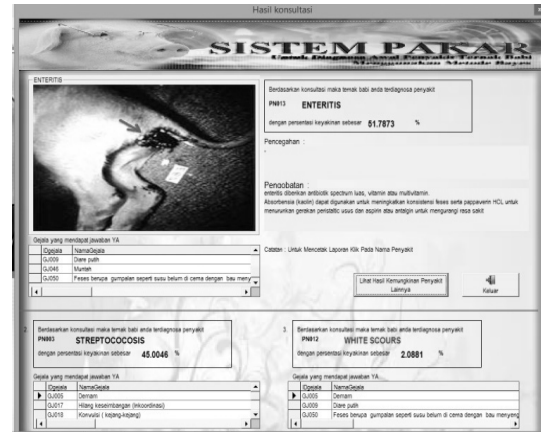
Gambar 2. Hasil Diagnosa

diantara penyakit-penyakit tersebut. Berikut contoh hasil diagnose menggunakan aplikasi Sistem Pakar.