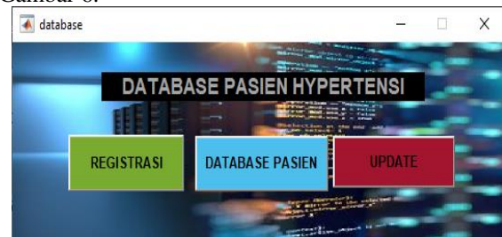
Gambar 2. Tampilan Halaman Database

Halaman Datebase adalah halaman untuk melakukan registrasi atau input data pasien baru, melihat datebase pasien yang telah disimpan dan mengupdate data pasien hipertensi. Dapat dilihat pada Gambar 6.