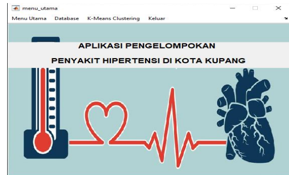
Gambar 1. Tampilan Halaman Menu Utama

Halaman Menu Utama Aplikasi Pengelompokan Penyakit Hipertensi di Kota Kupang Menggunakan Metode K-Means adalah halaman Utama untuk mengakses halaman lainnya pada aplikasi yang dibangun. Halaman ini terdapat Menu Utama, Datebase Dan K-Means Clustering . Halaman utama dapat dilihat pada Gambar 5.