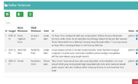
Gambar 4 Halaman Testimoni

seperti tombol tutup untuk membatalkan hapus data atau simbol X untuk menutup halaman hapus data.