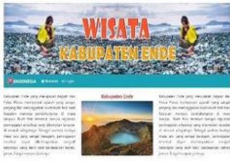
Gambar 2 Halaman Home

Halaman home merupakan antar muka awal yang dibuat pada website kabupaten Ende yang isinya terdapat informasi kegiatan, pengumuman dan menu login pengguna. Tampilan antar muka home dapat dilihat pada gambar 2 berikut ini.