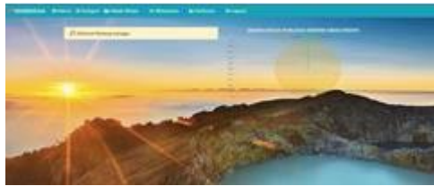
Gambar 1 Kelola Admin